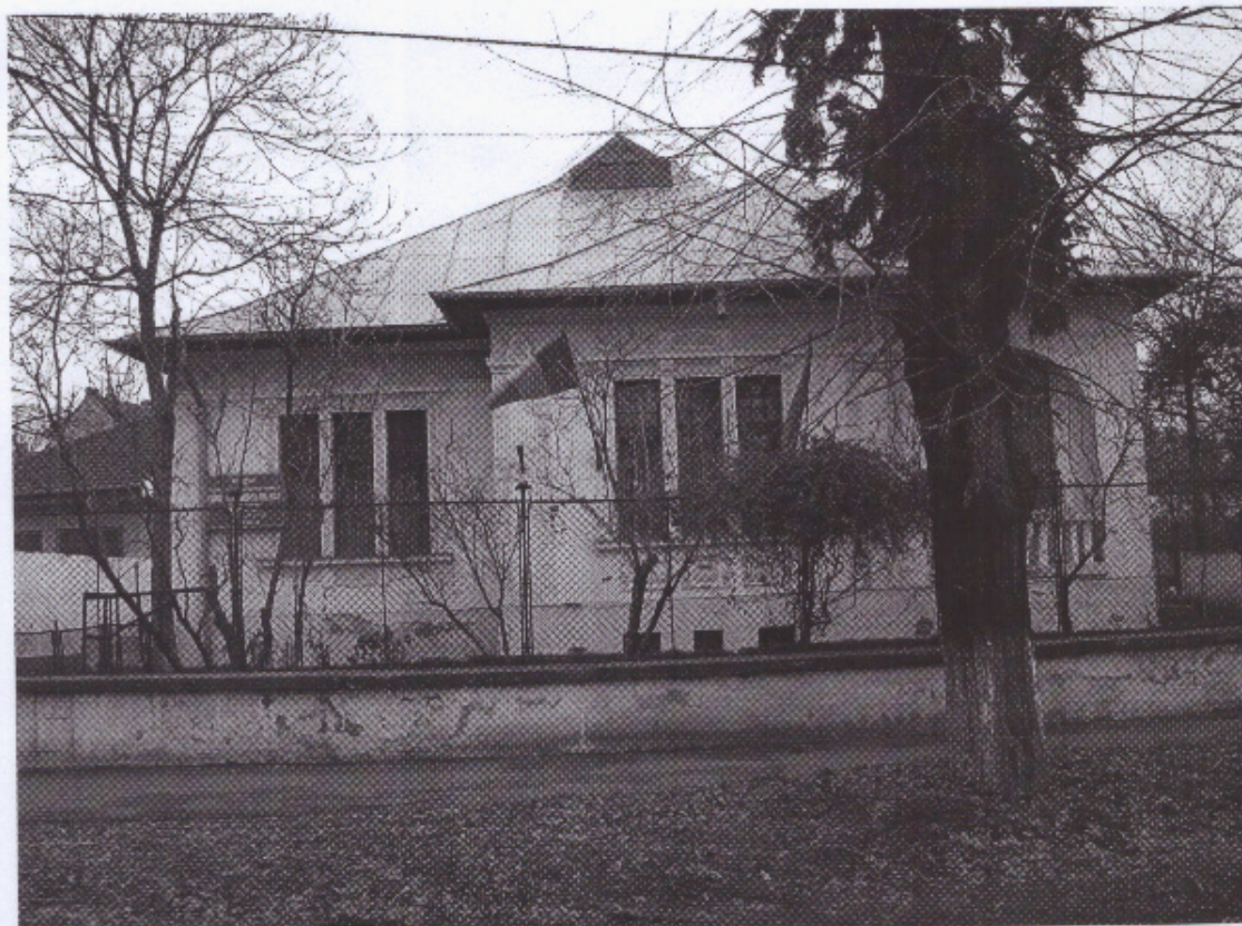
Figura nr.2 Structura nr.48- Grădinița de Copii cu Program Prolungit nr.48

Disponem de echipamente audio-vizuale, o bibliotecă ce cuprinde ghiduri metodice, reviste de specialitate, volume de versuri și literatură pentru copii, mini biblioteci în fiecare grupă, materiale didactice.