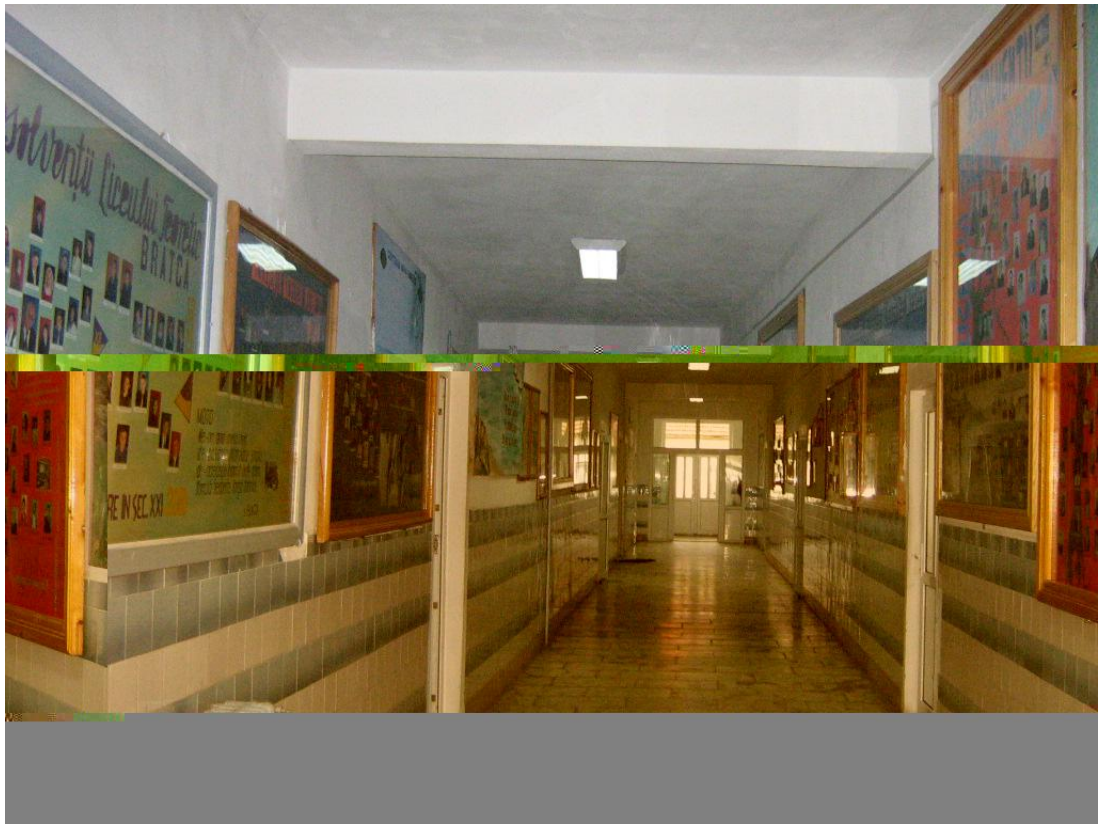
Imagini din școală